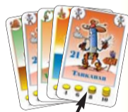
Minden játékos 5 lapot kap a kezébe. Ez az első lap!

Figyelem! A játékosok a kézbe kapott lapok sorrendjén nem változtathatnak, a lapokat nem válogathatják egymás mellé fajtánként, ahogy ez más kártyajátékokban engedélyezett. Ez azt jelenti, hogy a játékosoknak a lapokat úgy kell a kezükben tartani, ahogy azt az osztó játékos kiosztotta. A játék során is az új lapokat minden esetben a régiéik mögé kell illeszteni. Az osztó játékos a maradék lapokból egy lefordított (tallér oldalával felfelé) paklit („húzó-pakli”) képez az asztalon. A játékosok választanak egy kezdő játékosot.